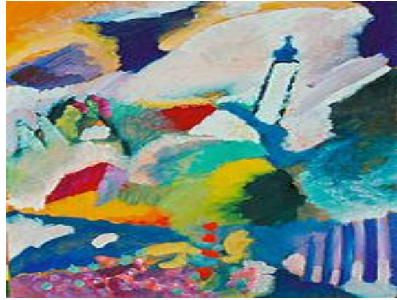
Kandinsky-Bild: Kirche in Murnau

Von Murnau aus kann man über den Staffelsee die Gipfel des Wettersteingebirges mit Zugspitze und Alpspitze im Süden sehen.