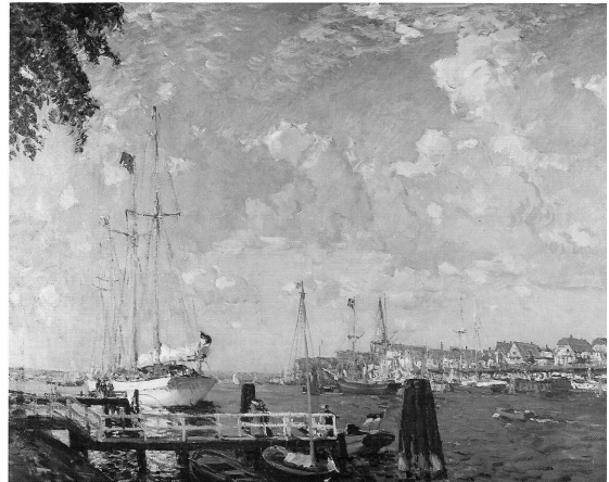
Ölbild von Ulrich Hübner: Travemünde 1910