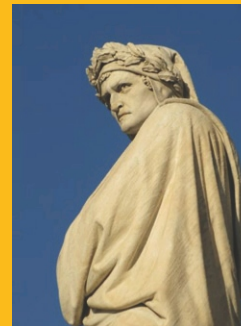
Bild: Florenz – vor Santa Croce Statue zu Ehren des Dichters der Göttlichen Komödie , Dante Alighieri (1265-1321)