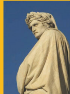
Bild: Florenz – vor Santa Croce Statue zu Ehren des Dichters der Göttlichen Komödie , Dante Alighieri (1265-1321)