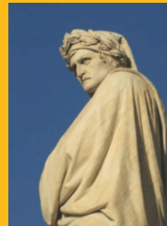
Bild: Florenz – vor Santa Croce Statue zu Ehren des Dichters der Göttlichen Komödie , Dante Alighieri (1265-1321)