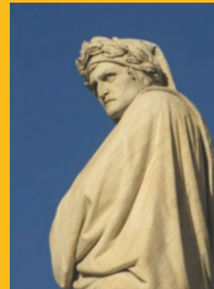
Bild: Florenz – vor Santa Croce Statue zu Ehren des Dichters der Göttlichen Komödie , Dante Alighieri (1265-1321)