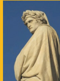
Bild: Florenz – vor Santa Croce Statue zu Ehren des Dichters der Göttlichen Komödie , Dante Alighieri (1265-1321)

LITERARISCH REISEN Pitschen-Pickel 30 15926 Heideblick