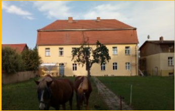
Bild: Das Gutshaus Pitschen während der Sanierung der Fassade im Sommer 2020. Das ehemalige Rittergut blickt auf eine Jahrhunderte alte Geschichte zurück. www.gutshaus-pitschen.jimdofree.com

Nur eine Stunde von Berlin entfernt liegt das zwischen Fläming und Spreewald gelegene Gutshaus Pitschen, ein spätbarocker Bau aus dem 18. Jahrhundert. Im Rahmen des neuen KulturGutssommers bieten wir schöne Ausstellungen und unterhaltsame Lesungen an.