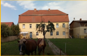
Bild: Das Gutshaus Pitschen während der Sanierung der Fassade im Sommer 2020. Das ehemalige Rittergut blickt auf eine Jahrhunderte alte Geschichte zurück. www.gutshaus-pitschen.jimdofree.com

Nur eine Stunde von Berlin entfernt liegt das zwischen Fläming und Spreewald gelegene Gutshaus Pitschen, ein spätbarocker Bau aus dem 18. Jahrhundert. Im Rahmen des neuen KulturGutsommers bieten wir schöne Ausstellungen und unterhaltsame Lesungen an.