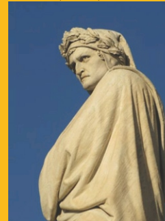
Bild: Florenz – vor Santa Croce Statue zu Ehren des Dichters der Göttlichen Komödie , Dante Alighieri (1265-1321)