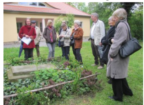
Am Grab von Johanna Schopenhauer

Dieser Rundgang ist den faszinierenden Frauen der romantischen Epoche Jenas gewidmet: der sehr geistreichen „Madame Luzifer“ alias Caroline Schlegel-Schelling, der ebenso scharfsinnigen aber manchmal arg klatschsüchtigen Dorothea Veit und der schönen, freiheitsliebenden Dichterin Sophie Mereau. Briefe und andere Lebensdokumente dieser Frauen machen das romantische, gesellige Leben in Jena um 1799/1800 lebendig.