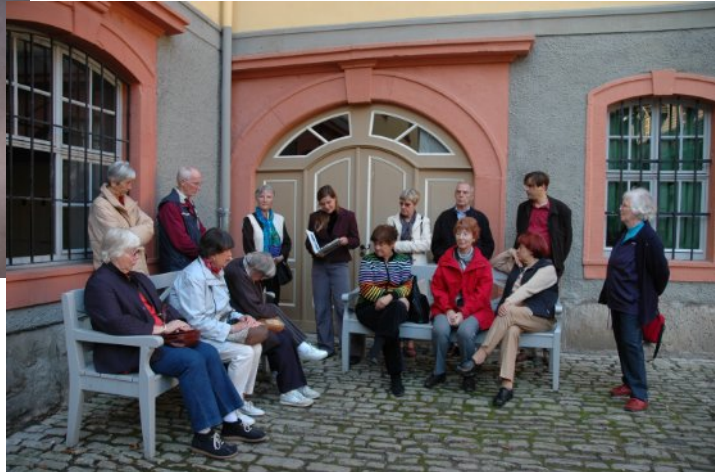
Vor dem Wittumspalais von Anna Amalia in Weimar