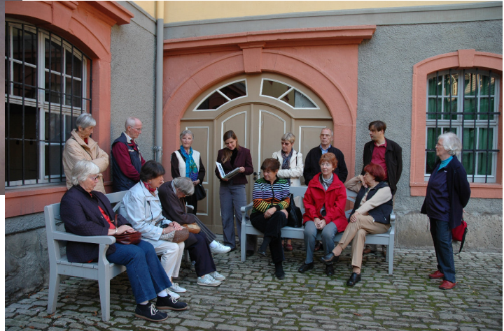
Vor dem Wittumspalais von Anna Amalia in Weimar