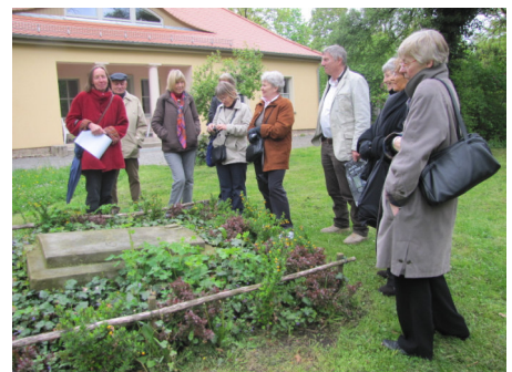
Am Grab von Johanna Schopenhauer

Dieser Rundgang ist den faszinierenden Frauen der romantischen Epoche Jenas gewidmet: der sehr geistreichen „Madame Luzifer“ alias Caroline Schlegel-Schelling, der ebenso scharfsinnigen aber manchmal arg klatschsüchtigen Dorothea Veit und der schönen, freiheitsliebenden Dichterin Sophie Mereau. Briefe und andere Lebensdokumente dieser Frauen machen das romantische, gesellige Leben in Jena um 1799/1800 lebendig.