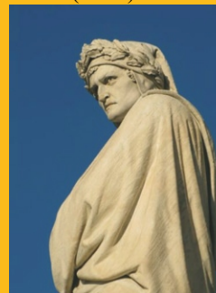
Bild: Florenz – vor Santa Croce Statue zu Ehren des Dichters der Göttlichen Komödie , Dante Alighieri (1265-1321)

LITERARISCH REISEN Pitschen-Pickel 30 15926 Heideblick