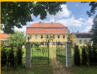
Bild: Das Gutshaus strahlt während des Sommers schön wie ein Landhaus in Frankreich. Das ehemalige Rittergut blickt auf eine viele Jahrhunderte alte Geschichte zurück.

Nur eine Stunde von Berlin entfernt liegt das zwischen Fläming und Spreewald gelegene Gutshaus Pitschen, ein spätbarocker Bau aus dem 18. Jahrhundert. Lassen Sie sich entführen zu einer literarischen Landpartie mit Lesungen und Ausstellungen im Gartensalon eines alten Rittergutes.