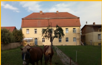
Bild: Das Gutshaus Pitschen während der Sanierung der Fassade im Sommer 2020. Das ehemalige Rittergut blickt auf eine Jahrhunderte alte Geschichte zurück. www.gutshaus-pitschen.jimdofree.com

Nur eine Stunde von Berlin entfernt liegt das zwischen Fläming und Spreewald gelegene Gutshaus Pitschen, ein spätbarocker Bau aus dem 18. Jahrhundert. Lassen Sie sich entführen zu einer literarischen Landpartie mit Lesungen und Ausstellungen im Gartensalon eines alten Rittergutes.