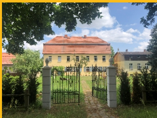
Bild: Das Gutshaus strahlt während des Sommers schön wie ein Landhaus in Frankreich. Das ehemalige Rittergut blickt auf eine viele Jahrhunderte alte Geschichte zurück.

Nur eine Stunde von Berlin entfernt liegt das zwischen Fläming und Spreewald gelegene Gutshaus Pitschen, ein spätbarocker Bau aus dem 18. Jahrhundert. Lassen Sie sich entführen zu einer literarischen Landpartie mit Lesungen und Ausstellungen im Gartensalon eines alten Rittergutes.