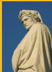
Bild: Florenz – vor Santa Croce Statue zu Ehren des Dichters der Göttlichen Komödie , Dante Alighieri (1265-1321)

LITERARISCH REISEN Pitschen-Pickel 30 15926 Heideblick