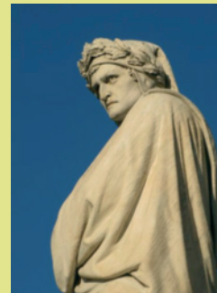
Bild: Florenz – vor Santa Croce Statue zu Ehren des Dichters der Göttlichen Komödie , Dante Alighieri (1265-1321)

LITERARISCH REISEN Tempelhofer Weg 26 10829 Berlin