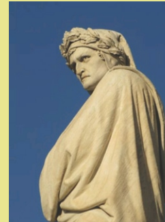
Bild: Florenz – vor Santa Croce Statue zu Ehren des Dichters der Göttlichen Komödie , Dante Alighieri (1265-1321)