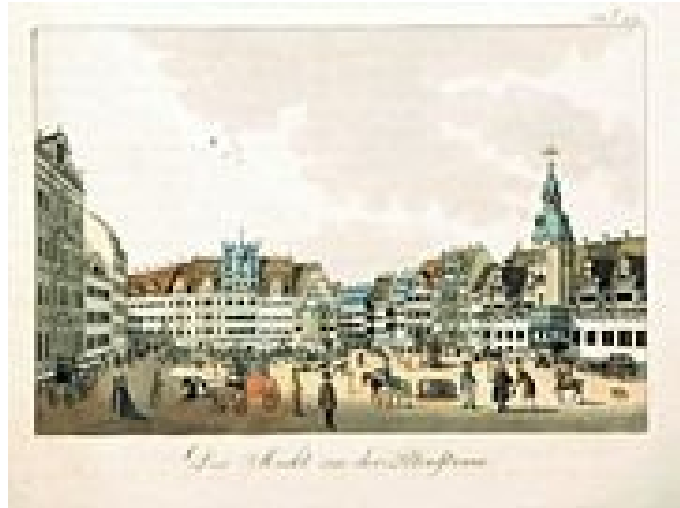
Stadtansicht mit Markt und Rathaus in Leipzig

Termin: 13. – 16. Juli 2023 und für Gruppen nach Vereinbarung