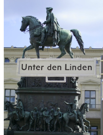
Friedrich II. mit Lessing und Kant unterm Pferdeschwanz

Termin: 28.-31. Juli 2021 und für Gruppen n.V.