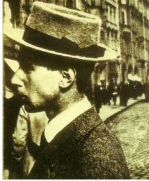
Brecht mit Hut